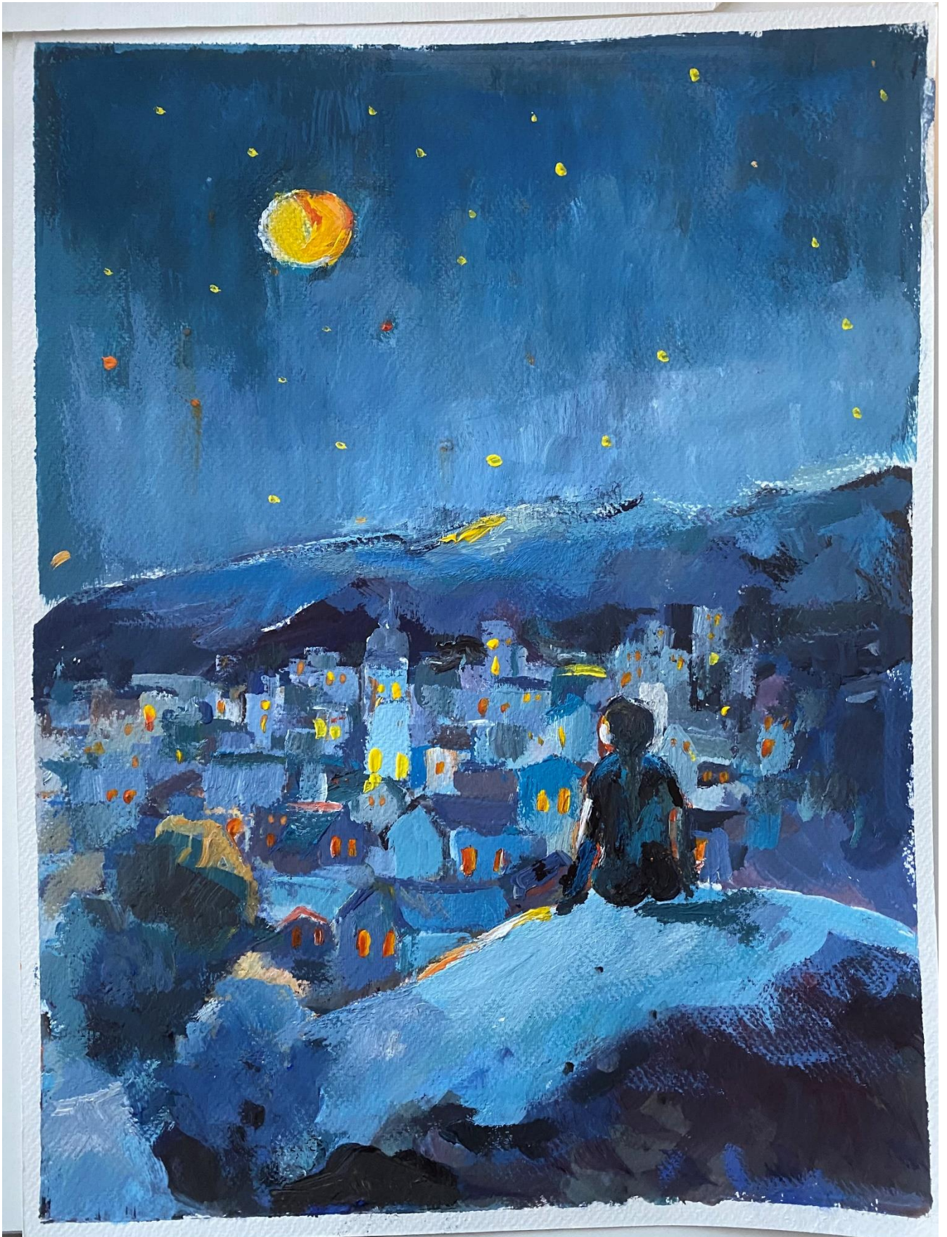
Nočni sij, Pia Rumpf, 1.f, tempera