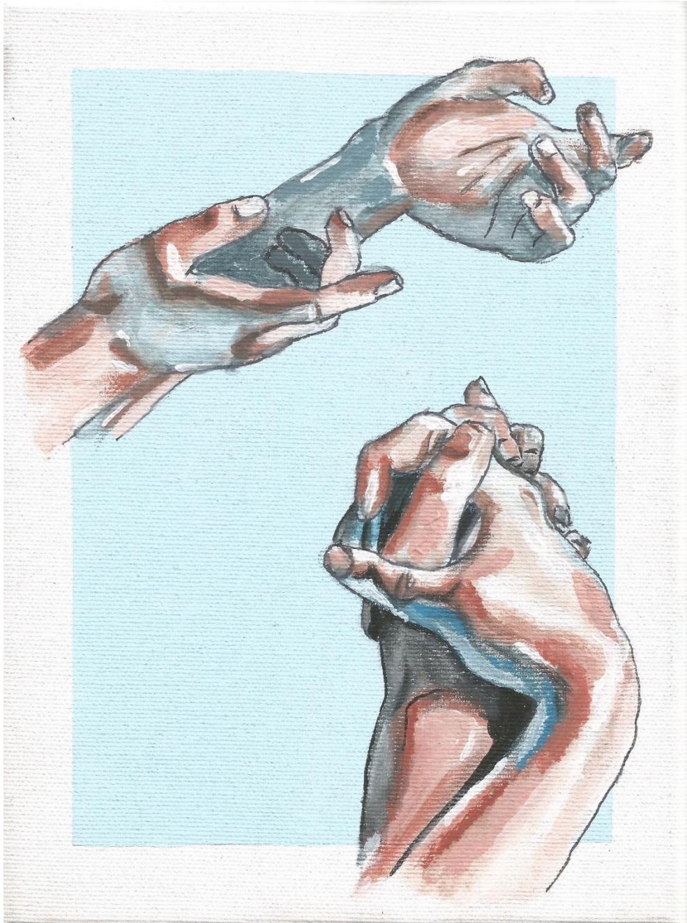
Elysian, Anja Hojsak, 2. a, akril