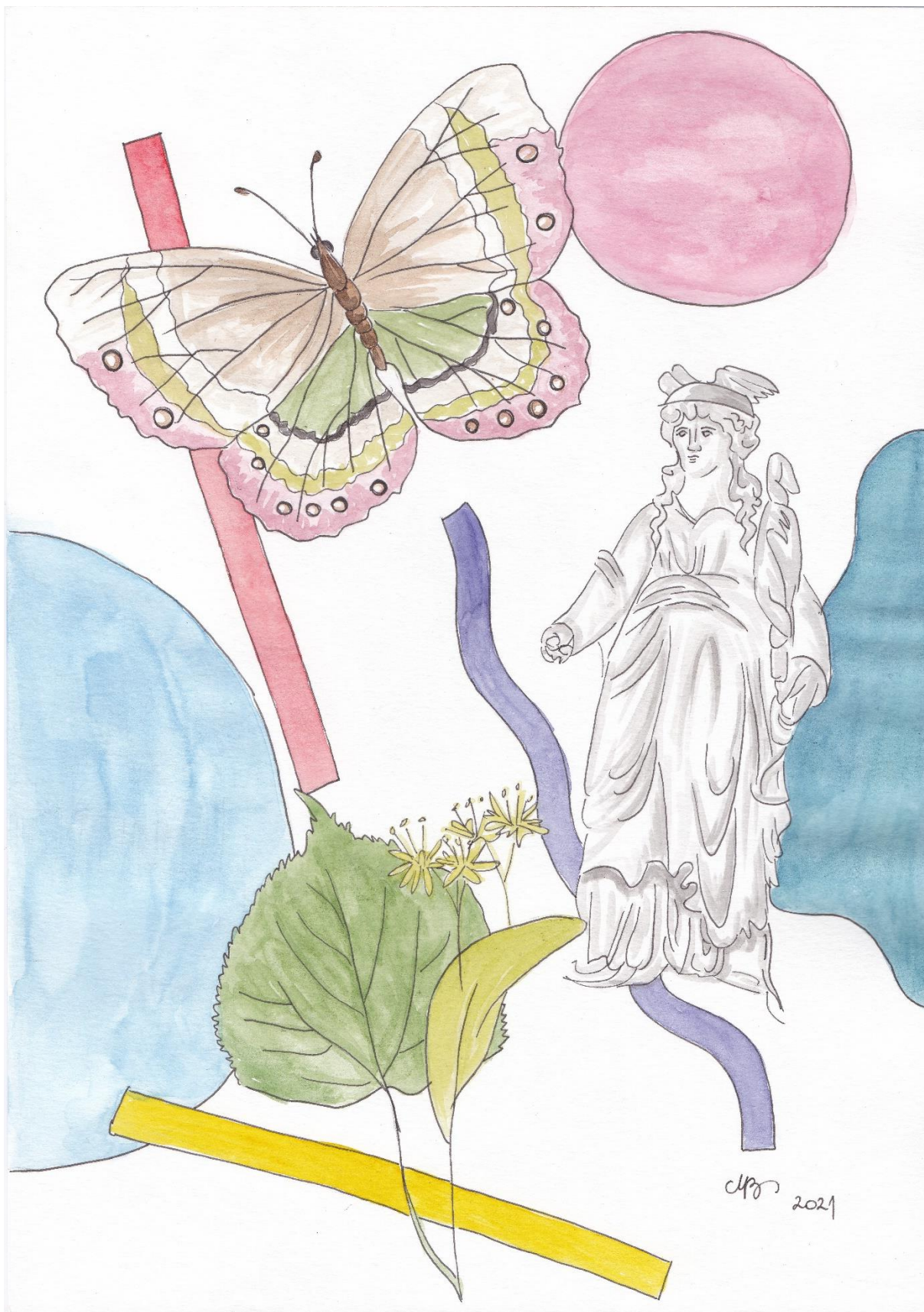
Spomini, Marko Balažič, 4. f, akvarel