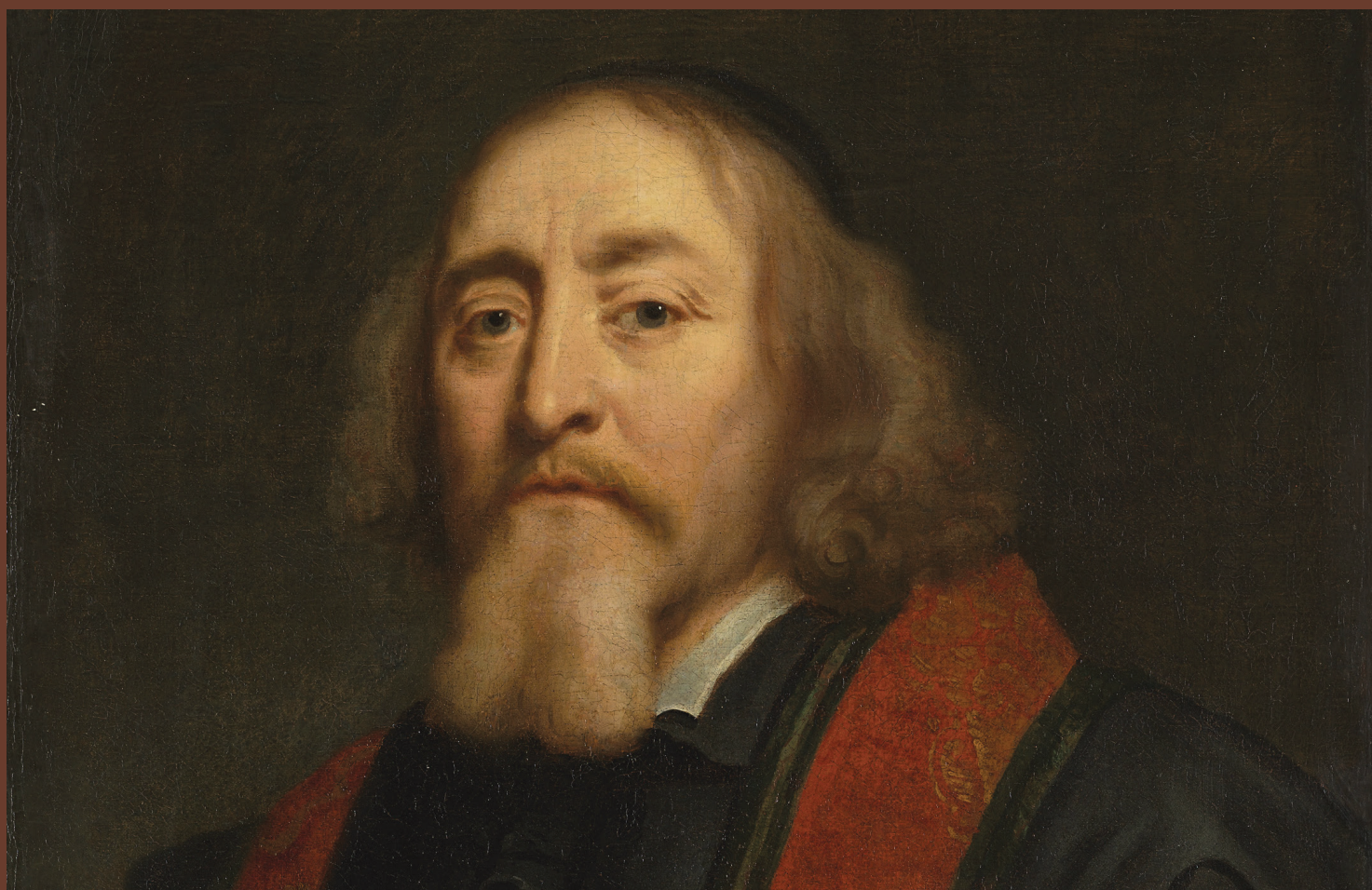
Jan Amos Komensky

Pred seboj lahko vidite OŠ Bojana Iliča, na kateri je freska češkega pedagoga Jana Komenskega; stavba je nekoč služila kot učiteljski dom. Komensky velja za utemeljitelja moderne pedagogike ter glavnega protagonista šolskih in vzgojnih reform. Nekatere od njegovih idej veljajo še danes, npr.: vzgoja vsesplošnega izobraževanja, zahteve po šolskem letu, šolskem tednu, učni uri, letnih počitnicah, telesnih vajah, o razredu kot zaključeni delovno-učni enoti. Njegova najpomembnejša dela so Odprta vrata k jeziku, Velika didaktika, Čutni svet v slikah.